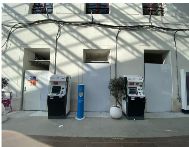
LE FUTUR ESPACE DE VENTES TER DE PARIS AUSTERLITZ EN TRAVAUX